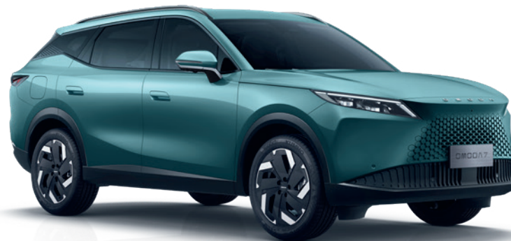
VERDE SAFIR (SY)