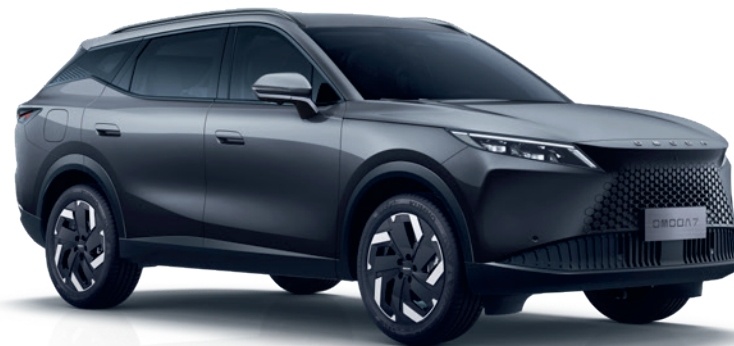
GRI COSMIC (UK)