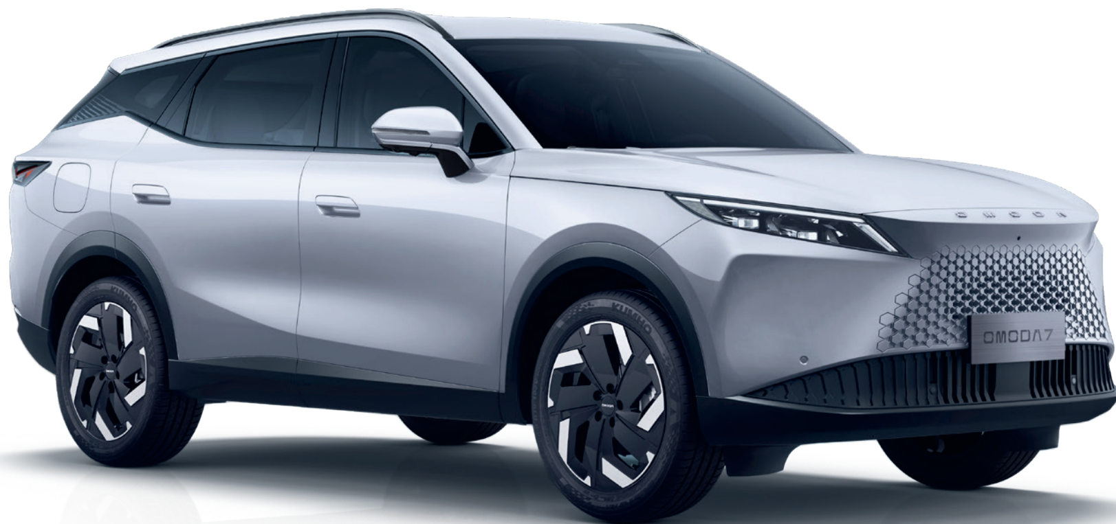
ALB ZĂPADĂ (BW)