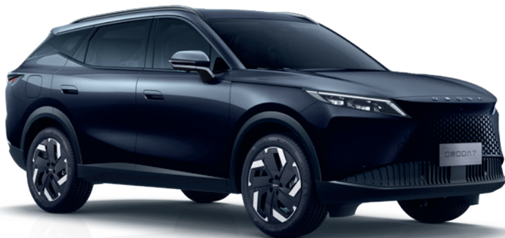
NEGRU CĂRBUNE (CL)