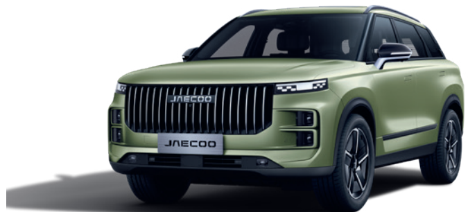
VERDE SMARALD (SP)