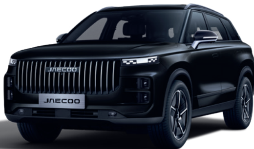
NEGRU CARBON (CL)

Culori extra - pentru versiunile Premium / Exclusive - 490 €