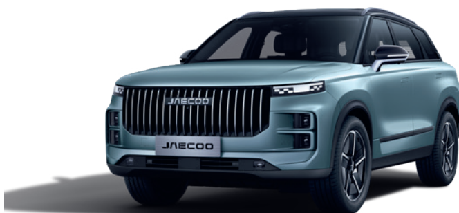
GRI BI-TONE (ZK)