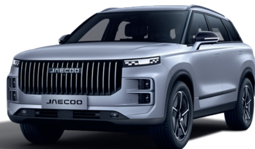
ARGINTIU LUNĂ (KU)