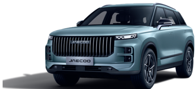
GRI MĂSLINIU (UD)