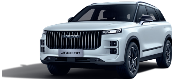
ALB ZĂPADĂ (BW)

Culori extra - pentru versiunile Premium / Exclusive - 490 €