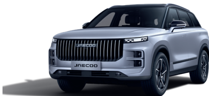
ARGINTIU BI-TONE (ZN)