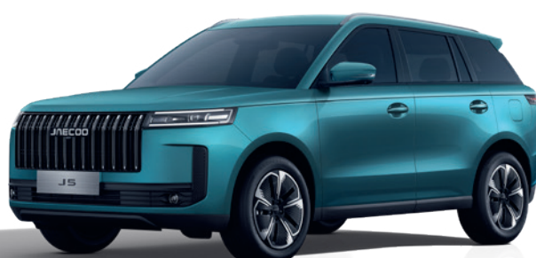
VERDE ALPIN (LQ)