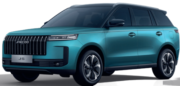
VERDE ALPIN CU ACOPERIȘ NEGRU (Z6)