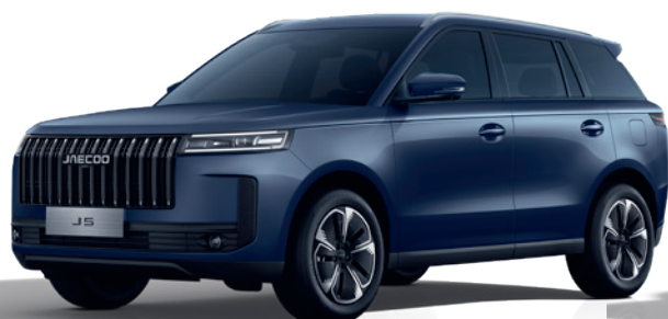
ALBASTRU GHEȚAR (WS)