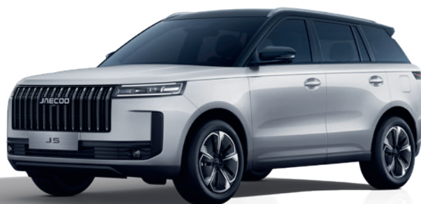
ALB ZĂPADĂ CU ACOPERIȘ NEGRU (ZE)