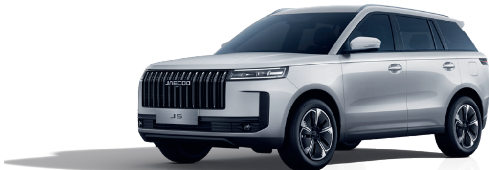
ALB ZĂPADĂ (BW)