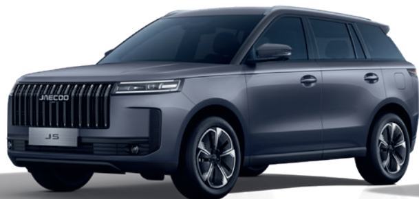
GRI MĂSLINIU (GV)