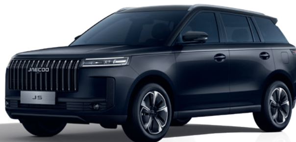
NEGRU CANION (CL)