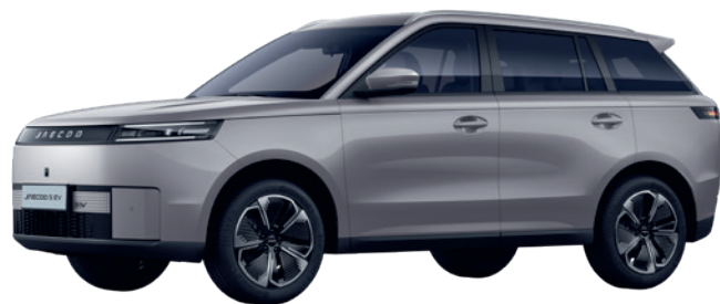
GRI FIORD (UR)