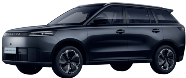
NEGRU CANION (CL)