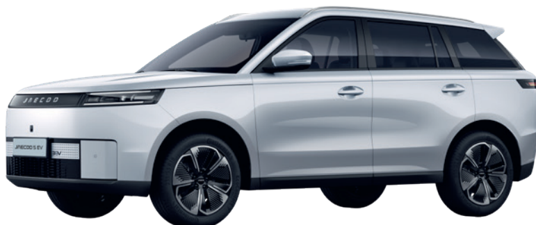
ALB ZĂPADĂ (BW)