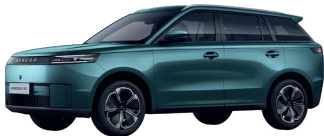
VERDE ALPIN (LQ)