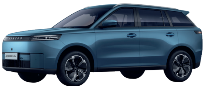
ALBASTRU GHEȚAR (WS)