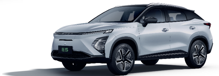
CULOARE ÎN DOUĂ TONURI: DUO ALB (ZE)