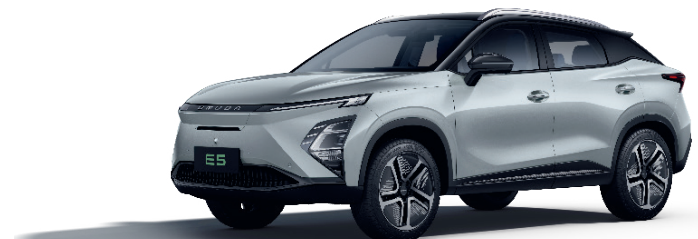
CULOARE ÎN DOUĂ TONURI: DUO METALIZAT (X4)