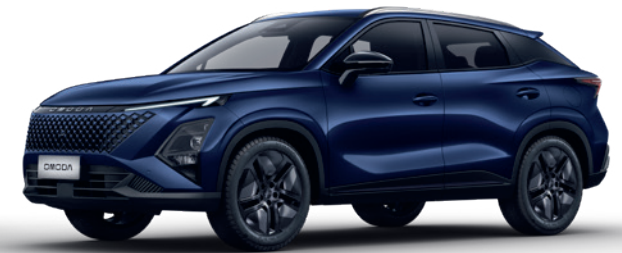
ALBASTRU INCHIS (WB)