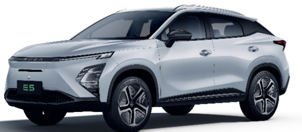
ALB ZĂPADĂ (BW)