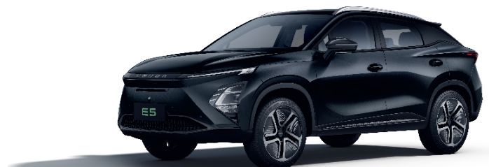
NEGRU CĂRBUNE (CL)