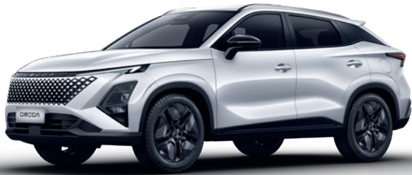
ALB ZĂPADĂ (BW)