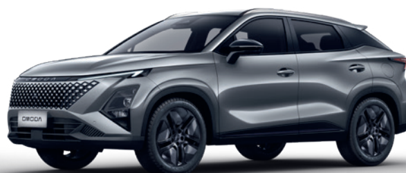
GRI FANTOMĂ (GV)