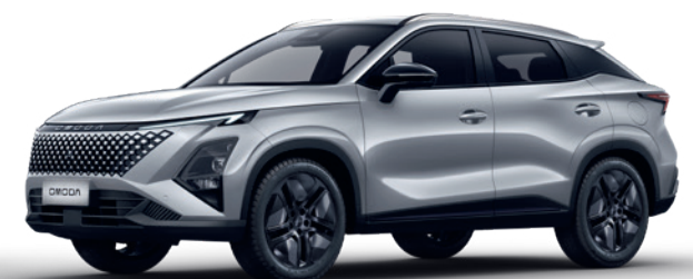
METAL ARGINTIU (KX)