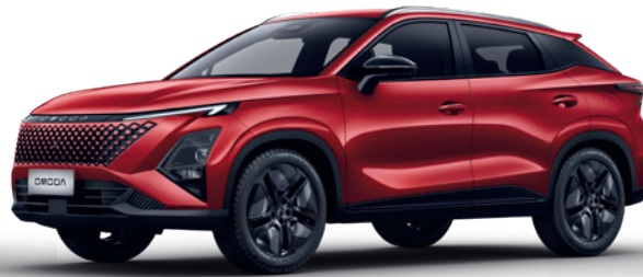
ROSU RUBIU (NL)