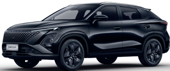
NEGRU CĂRBUNE (CL)