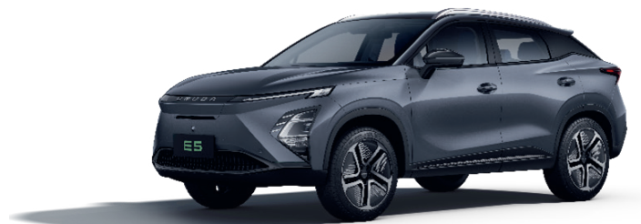
GRI FANTOMĂ (GV)